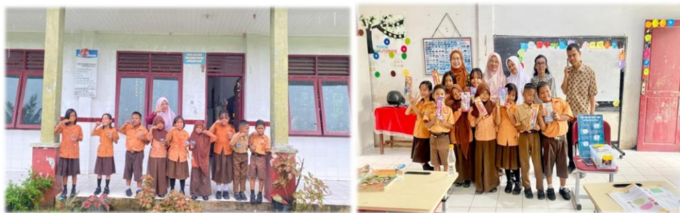
Gambar 2. Pengabdian Masyarakat

Setelah dilaksanakan edukasi kesehatan gigi terutama menyampaikan tentang waktu, frekuensi dan cara menyikat gigi, umumnya siswa menjadi paham tentang waktu menyikat gigi yakni pagi setelah sarapan dan malam sebelum tidur. Frekuensi sikat gigi 2 kali dalam sehari, mengurangi makanan yang manis-manis dan mudah lengket dan memahami cara menyikat gigi yang baik dan benar.