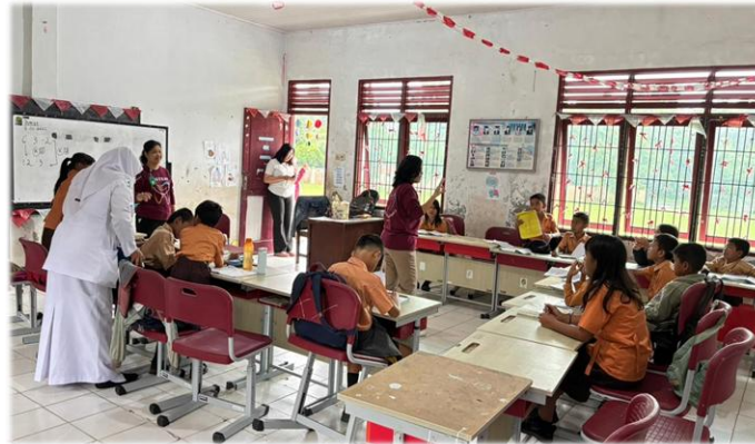
Gambar 3. Kegiatan Sosialisasi

sebaiknya dilakukan secara tekun, teliti dan teratur. Waktu yang paling tepat untuk menyikat gigi adalah setiap selesai sarapan dan sebelum tidur malam. Hal penting dalam menjaga kebersihan gigi dan mulut adalah kesadaran dalam perilaku pemeliharaan diri masing-masing individu (Putri M. H., Eliza H., Neneng N., 2013).