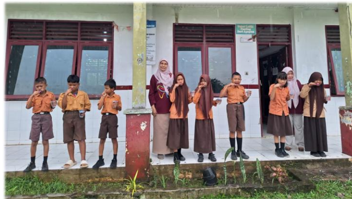
Gambar 4. Kesadaran kebersihan gigi

Usia sekolah merupakan masa untuk meletakkan landasan kokoh bagi terwujudnya manusia yang berkualitas dan kesehatan merupakan faktor penting yang menentukan kualitas sumber daya manusia. Peran sekolah sangat diperlukan dalam upaya pemeliharaan kesehatan gigi dan mulut anak, karena faktor lingkungan yang salah satunya adalah sekolah memiliki kekuatan besar dalam menentukan perilaku kebiasaan menyikat gigi pada anak yang dilakukan dalam kehidupan sehari-hari tanpa ada perasaan terpaksa.