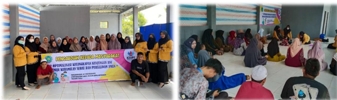
Gambar 2. Foto Kegiatan

Kegiatan dilaksanakan dengan memberikan sosialisasi yang di sampaikan oleh salah satu perwakilan kelompok, acara berlangsung dengan baik karena di isi dengan sosialisasi dengan penuh semangat dan pembagian hadiah-hadiah untuk peserta yang dapat menjawab pertanyaan yang di berikan. Peserta yang dapat menjawab pertanyaan akan di berikan hadiah dari kelompok sebagai evaluasi tolak ukur apakah materi yang sudah di sampaikan dapat di mengerti oleh peserta. Selain itu kelompok memberikan leaflet agar peserta bisa membaca materi yang di sampaikan dengan baik.