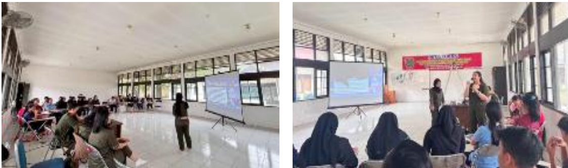
Gambar 6. Pemberian penyuluhan mengenai DBD di Panti Sosial Karya Wanita Palangka Raya

Kegiatan keenam berupa penyuluhan mengenai “Kenali Tanda-Tanda Bahaya Demam Berdarah Dengue (DBD)” yang dilaksanakan pada tanggal 22 Agustus 2025 dan 27 Agustus 2025 di Panti Sosial Karya Wanita dengan jumlah peserta sebanyak 30 orang. Materi yang disampaikan meliputi tanda bahaya DBD, siklus hidup nyamuk Aedes aegypti , serta upaya pencegahan melalui pemberantasan sarang nyamuk dengan metode 3M Plus. Kegiatan dilakukan menggunakan media PowerPoint, leaflet, dan diskusi interaktif.