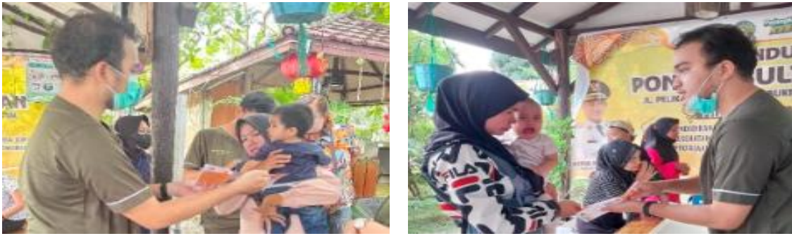
Gambar 5. Pemberian penyuluhan mengenai stunting di Posyandu Pondok Sultan Palangka Raya

pengetahuan masyarakat mengenai pencegahan gangguan pertumbuhan pada anak sejak dini.