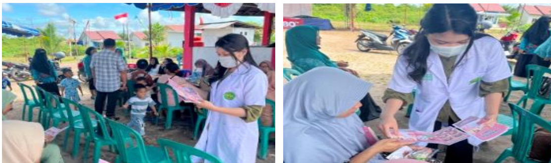
Gambar 3. Pemberian penyuluhan mengenai diare di Posyandu Kasih Bunda Palangka Raya

Kegiatan ketiga berupa penyuluhan mengenai diare yang juga dilaksanakan pada tanggal 19 Agustus 2025 di Posyandu Kasih Bunda dengan jumlah peserta sebanyak 12 orang. Materi edukasi yang disampaikan meliputi penyebab diare, tanda dan gejala, upaya pencegahan, perilaku hidup bersih dan sehat, serta penanganan awal untuk mencegah dehidrasi. Peserta terlihat aktif selama kegiatan berlangsung dan mampu mengikuti diskusi dengan baik. Penyuluhan kesehatan mengenai diare penting dilakukan sebagai upaya promotif dan preventif untuk meningkatkan kesadaran masyarakat mengenai pentingnya sanitasi dan kebersihan lingkungan dalam pencegahan penyakit infeksi.