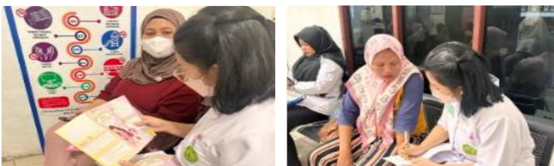
Gambar 4. Pemberian penyuluhan mengenai keluarga berencana di ruang tunggu Puskesmas Kayon

Kegiatan keempat berupa penyuluhan mengenai keluarga berencana yang dilaksanakan pada tanggal 20 Agustus 2025 di ruang tunggu UPTD Puskesmas Kayon dengan jumlah peserta sebanyak 10 orang ibu hamil. Materi yang disampaikan meliputi pentingnya perencanaan kehamilan, manfaat keluarga berencana, serta jenis-jenis alat kontrasepsi yang dapat digunakan. Penyampaian materi dilakukan menggunakan media leaflet dan komunikasi interaktif sehingga peserta dapat memahami informasi kesehatan yang diberikan dengan lebih mudah. Edukasi kesehatan mengenai keluarga berencana memiliki peran penting dalam meningkatkan pemahaman masyarakat mengenai kesehatan reproduksi dan perencanaan keluarga yang sehat.