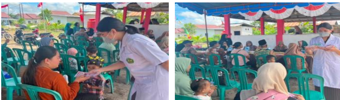
Gambar 2. Pemberian penyuluhan mengenai myalgia di Posyandu Kasih Bunda Palangka Raya

Kegiatan kedua berupa penyuluhan mengenai myalgia yang dilaksanakan pada tanggal 19 Agustus 2025 di Posyandu Kasih Bunda dengan jumlah peserta sebanyak 12 orang. Materi penyuluhan meliputi pengertian myalgia, faktor risiko, keluhan nyeri otot, penanganan awal, serta pentingnya aktivitas fisik dan istirahat yang cukup. Kegiatan dilakukan melalui metode ceramah dan diskusi interaktif sehingga peserta dapat memahami materi yang diberikan dengan lebih baik. Peserta menunjukkan antusiasme selama kegiatan berlangsung melalui sesi tanya jawab mengenai keluhan nyeri otot yang sering dialami dalam aktivitas sehari-hari. Penyampaian edukasi kesehatan secara langsung kepada masyarakat dapat membantu meningkatkan kesadaran masyarakat terhadap upaya pencegahan dan penanganan awal masalah kesehatan secara mandiri.