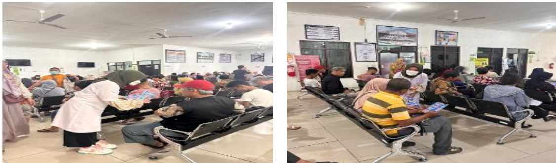
Gambar 1. Pemberian penyuluhan mengenai hipertensi di ruang tunggu Puskesmas Kayon

Kegiatan pertama berupa penyuluhan kesehatan mengenai hipertensi yang dilaksanakan pada tanggal 19 Agustus 2025 di ruang tunggu Puskesmas Kayon dengan jumlah peserta sekitar 25 orang yang sebagian besar merupakan pasien dewasa dan lansia. Materi yang disampaikan meliputi pengertian hipertensi, faktor risiko, komplikasi, pencegahan, serta pentingnya kepatuhan pengobatan dan penerapan pola hidup sehat. Penyampaian materi dilakukan menggunakan media leaflet dan diskusi interaktif sehingga peserta lebih mudah memahami informasi kesehatan yang diberikan. Selama kegiatan berlangsung, peserta terlihat aktif mengajukan pertanyaan mengenai pola makan, konsumsi garam, serta pengendalian tekanan darah sehari-hari. Kegiatan penyuluhan kesehatan seperti ini dinilai efektif dalam meningkatkan pengetahuan masyarakat mengenai pencegahan penyakit tidak menular, khususnya hipertensi.