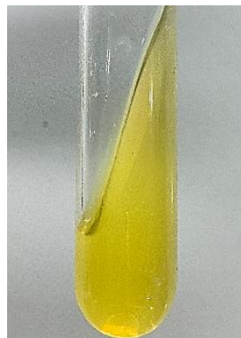
Gambar 5. Seluruh isolat (S1-S6) menunjukkan hasil negatif pada uji urease yang ditandai dengan tidak adanya perubahan warna media menjadi merah muda.

menunjukkan bahwa bakteri tidak memiliki enzim urease sehingga tidak mampu menghidrolisis urea menjadi amonia dan karbon dioksida.