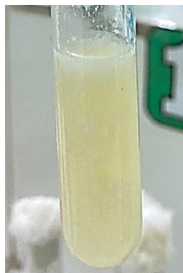
Gambar 1. Pertumbuhan bakteri pada sampel susu sapi (S1-S6) setelah inkubasi dalam media TSB yang ditandai dengan perubahan media menjadi keruh

itu, sebagian besar sampel juga menunjukkan adanya endapan yang mengindikasikan jumlah mikroorganisme yang cukup tinggi.