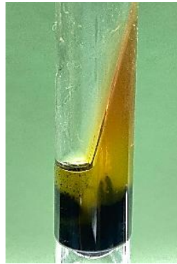
Gambar 4. Hasil uji TSIA Isolat (S1-S6) menunjukkan reaksi K/A dengan H 2 S positif.